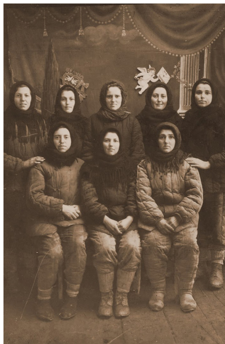
3. Illusztráció: Kényszermunkára hurcolt püspöknádasdi lányok, asszonyok a kaukázusi Groznijban (Stari Promislav vagy Andrewski láger). A szép bársonyfüggönyös, angyalkás háttér a szovjet propaganda része volt. A vezetéknevek is önmagukért beszélnek: Arnold, Gradwohl, Keszler, Müller, Breitenbach, Keller, Schraub, Reisz, 1946

Beszéltek nekem az elhurcoltak elképzelhetetlen szenvedésekről, az iszonyú első évről, az ismeretlen felé vezető „halálútról”, az éhezésről, a borzalmas munkakörülményekről, a csontig hatoló hidegről, betegségekről, halálról. Beszéltek a kínzó honvágyról, a kiszolgáltatottságukról, emberi aljasságokról, erőszakról, sírásról, kilátástalanságról. De beszéltek arról is, hogy volt „lágerboldogság” is, mert túl akartak élni. Beszéltek az ott élő emberek szegénységéről, és arról is, hogy ennek ellenére sem hagyták őket éhen halni: koldulni jártak élelemért, és mindig kaptak valamit tőlük, ezért a mai napig hálások nekik.