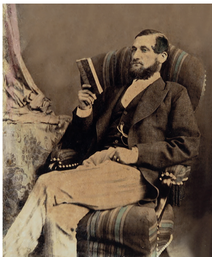
3. kép: Juhász László (1842–1911) (JPM Új- és Legújabbkori Gyűjteményi Oszttály, Gy.sz.: 117/1903.)

Végül a Juhász-kiállítás megszervezéséhez mégis hozzájárult a város, 109 de a közgyűlésben ezután is inkább kételkedést, 110 semmint örömet vagy büszkeséget szült, hogy Majorossy polgármester javaslatára az 1898-ban Pécsen üléselő bányászati és kohászati kongresszus felvette programjába a kiállítás megtekintését. 111 A Pécsi Napló szerint pedig a kiállítás ügye iránt Fraknói Vilmos múzeumi országos főfelügyelő, talán melegebben érdeklődik, mint maga a pécsi intelligencia. 112