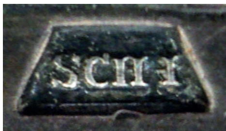
4. kép: Schönwald Imre névjele/gyártójele egy ezüst tálcába beütve (Készítette Szekeeres B., magángyűjtemény)

Ismert Schönwald névjele (más néven gyártó jele) és forgalmazói jelzése, amikkel az érmeket elláthatta (a nemesfémből készült érmeket a korabeli előírás szerint névjellel és fémjellel kellett ellátni. (4. és 5. kép)