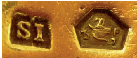
6. kép: Schönwald Imre feltételezett névjele egy arany gyűrűben (SI monogram) és a pécsi fémjelző fémjele (Készítette: Fekete K., magángyűjtemény)