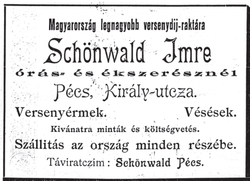
2. kép: Schönwald Imre hirdetése a Kerékpár-Sport című folyóiratban (1898. december 10. 15. oldal)