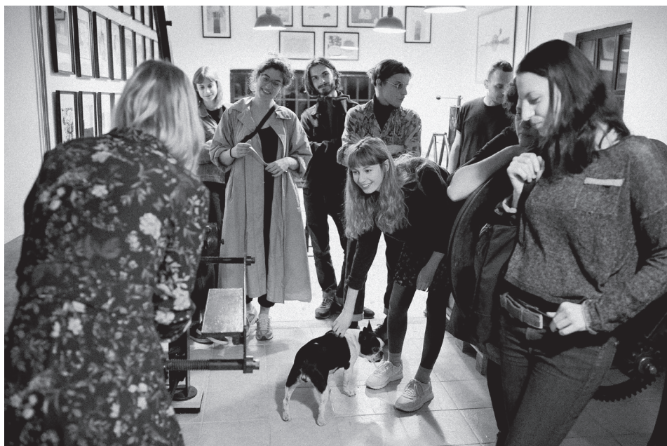
2. kép: Tervezőgrafikusok közössége 2021-ben a műhely Basamalom utcába költözése után