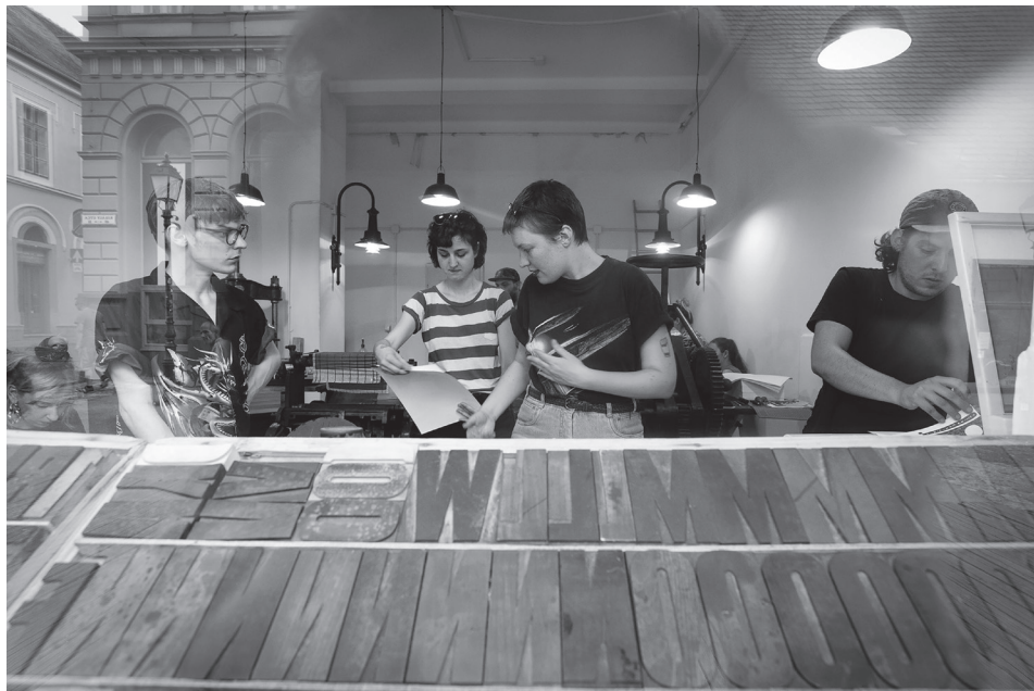
1. kép: Közösségi kiadvány kivitelezése a Drukker első közösségi nyomdaműhelyben, 2018-ban